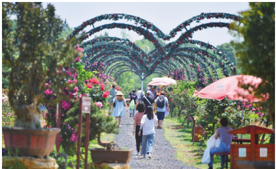
洋沙湖“五·一”假期迎来客流小高峰。

【本报讯】五·一小长假期间，在洋沙湖旅游景区，开展了一场主题为“五彩乐游·国风穿越”的五一特别活动，恶霸抢亲国风快闪秀、全民状元行趣味打卡、五彩花田摇摆桥挑战赛等乐趣横生的活动内容，让游客在洋沙湖旅游景区度过了充满欢声笑语的假期。 上午11点，随着一阵传统的喜庆音乐响起，一群身穿古装的表演者步履欢快的走入渔寮小镇，吸引了往来游客的目光，纷纷驻足观赏这场特别的古代抛绣球迎亲的文化表演，不出片刻，现场已是人