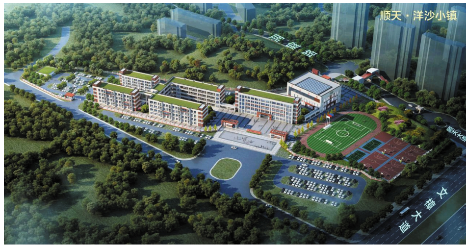
洋沙湖一小效果图。

的呈现。 优质教育资源的落位，始终是提升区域综合实力的有效催化剂。洋沙湖一小由湖南顺天集团投资建设，位于洋沙湖旅游景区东区，规划学校净用地面积高达约47170.83㎡，总建筑面积17767.57㎡，规划教学班36个，拟建教学楼、行政综合楼、生活馆、各类球场、环形跑道等多个教学设施，可容纳学生约1620人。按县教育局意见，以全年级高标准教学班大笔规划，高起点、高标准建设一所九年一贯制学校。建成后由湘阴教育局统筹管理，通过公开招