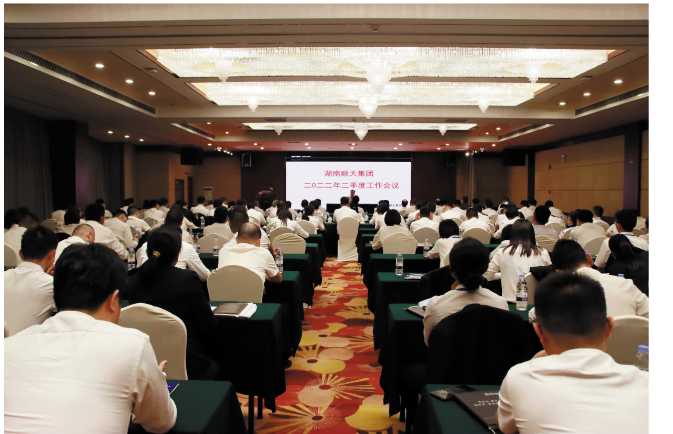
2022年5月5日，湖南顺天集团2022年二季度工作会议在顺天黄金海岸大酒店顺利召开。

动作为。各公司在现有的基础上还要深挖潜力，提前预见并做好应对市场环境不确定性带来的风险，最大限度减少疫情对经营经济的负面影响。日前，国务院出合部署稳经济一揽子措施，为市场经济注入了活力，各公司在发力的同时也要借力，充分利用好集团内人才、信息、渠道、资源的共享，加速内